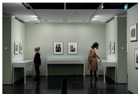
004 Fondation HCB, 79 rue des Archives, novembre 2018 Salle H, salle d'expositions Exposition Martine Franck