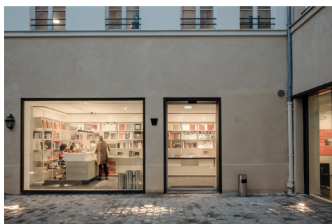
001 Fondation HCB, 79 rue des Archives, novembre 2018 Accueil