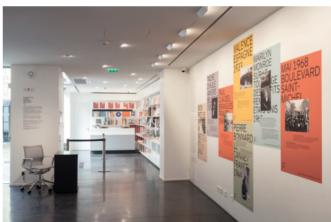
003 Fondation HCB, 79 rue des Archives, novembre 2018 Perles des Archives et librairie