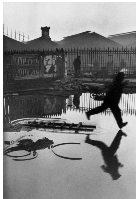
Derrière la gare Saint-Lazare, Place de l'Europe, Paris, 1932