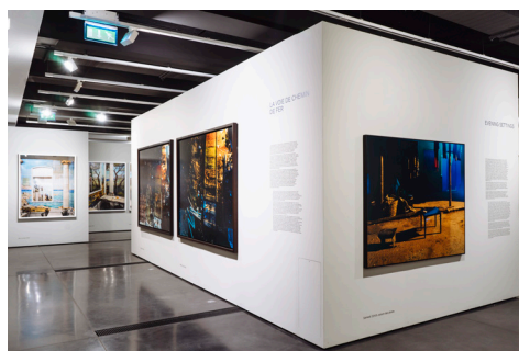
005 Fondation HCB, 79 rue des Archives, février 2020 Salle H, salle d'expositions Exposition Marie Bovo