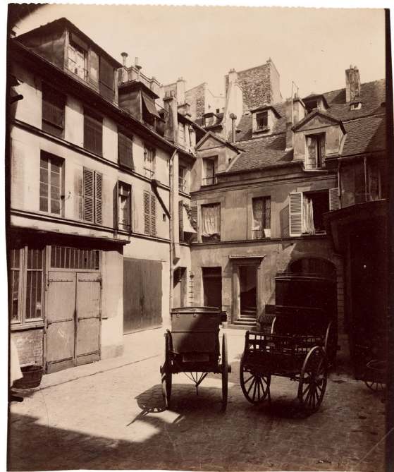
Vieille maison, 6, rue de Fourcy, IV e , 1910

précédent même si le regard sur son œuvre reste encore parfois contrasté. Le photographe, chargé d'une chambre photographique et de plaques de verre, saisit souvent ses images au lever du jour et s'attache à collectionner le vieux Paris pendant une trentaine d'années. Il explore aussi la limite de la ville, que l'on appelle « la zone ». Ses images de rues quasi-désertes, de devantures de magasins et de cours témoignent aujourd'hui des changements urbanistiques réalisés au tournant du XX ème siècle.