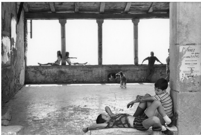
Simiane-la-Rotonde, France, 1969

La BnF dévoile au public français « Henri Cartier-Bresson. Le Grand Jeu », un projet inédit autour de la Master Collection du photographe. L'exposition est le fruit d'une collaboration exceptionnelle entre la Bibliothèque nationale de France et Pinault Collection, avec le concours de la Fondation Henri Cartier-Bresson. Après une première étape au Palazzo Grassi, à Venise, l'automne dernier, elle est présentée à Paris, dans un parcours scénographique spécialement adapté pour les espaces de la BnF.