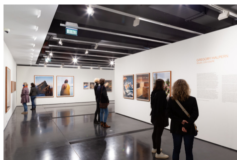
006 Fondation HCB, 79 rue des Archives, octobre 2020 Salle H, salle d'expositions Exposition Gregory Halpern