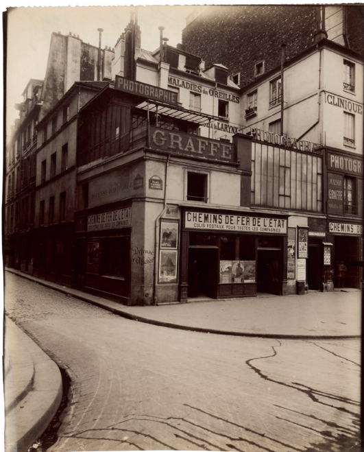
Coin de la place Saint-André-des-Arts et de la rue Hautefeuille, VI e , 1912

À partir des collections du musée Carnavalet - Histoire de Paris, l'exposition présentée à la Fondation HCB est le fruit d'un long travail de recherche entrepris conjointement par les deux institutions. Le résultat est une exposition exceptionnelle autour de l'œuvre d'Eugène Atget (1857-1927), figure atypique et pionnière de la photographie. Avant tout artisan, dont la production prolifique d'images est destinée aux artistes et amateurs du vieux Paris, c'est à titre posthume qu'Eugène Atget accède à la notoriété. Critiques et photographes perçoivent dans ses images de Paris l'annonce de la modernité. Parmi eux, Henri Cartier-Bresson, qui cherche à l'imiter dans ses premières images. Ainsi, la place de Paris dans l'œuvre de Cartier-Bresson fera l'objet d'une exposition au musée Carnavalet du 15 juin au 31 octobre 2021, projet conçu avec la Fondation HCB.