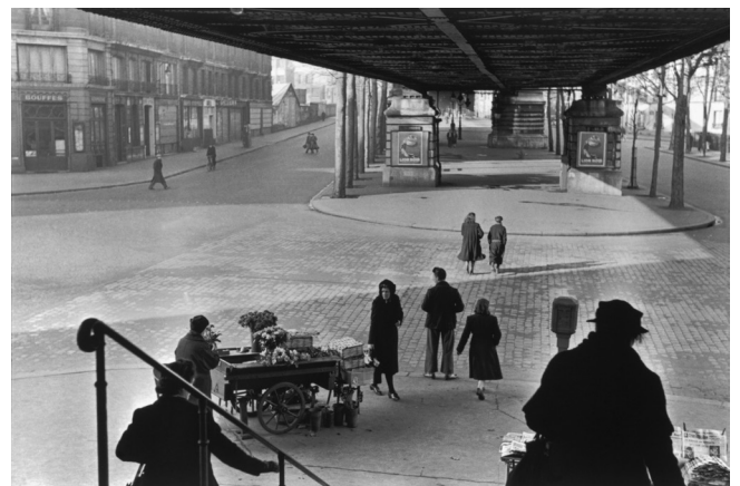
Sous le métro aérien, Boulevard de la Chapelle, Paris, 1951