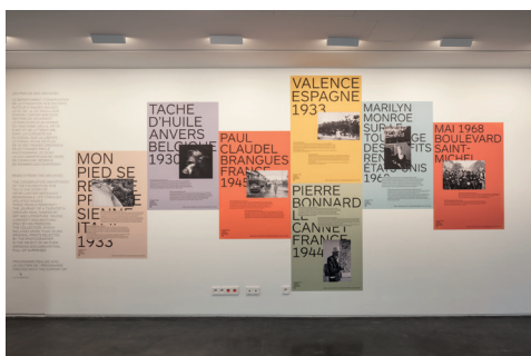
002 Fondation HCB, 79 rue des Archives, novembre 2018 Perles des Archives